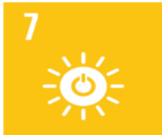
Hållbar energi för alla