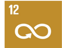
Hållbar konsumtion och produktion