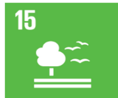
Ekosystem och biologisk mångfald